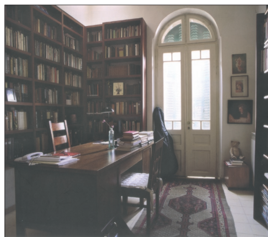
קירות ורוח 103 חדרי עבודה של סופרים ומשוררים טלי אמיתי-טביב

שנים רבות עם צורות שונות של ביטוי אמנותי דרך החללים שמכילים אותן: ספריות, מוניאונים ואולמות קונצרטים. בצילומיה בחללים הללו, כמו גם בצילומים של חדרי העבודה, היא מקפידה לרוקן את המקום מאנשים. "האדם היוצר נוכח (נמצא) באמצעות המקום שיצר ופעל בו ודרך המרחב והחלל שהקיף בהם את עצמו", היא פותבת. אך בעוד שספריות,