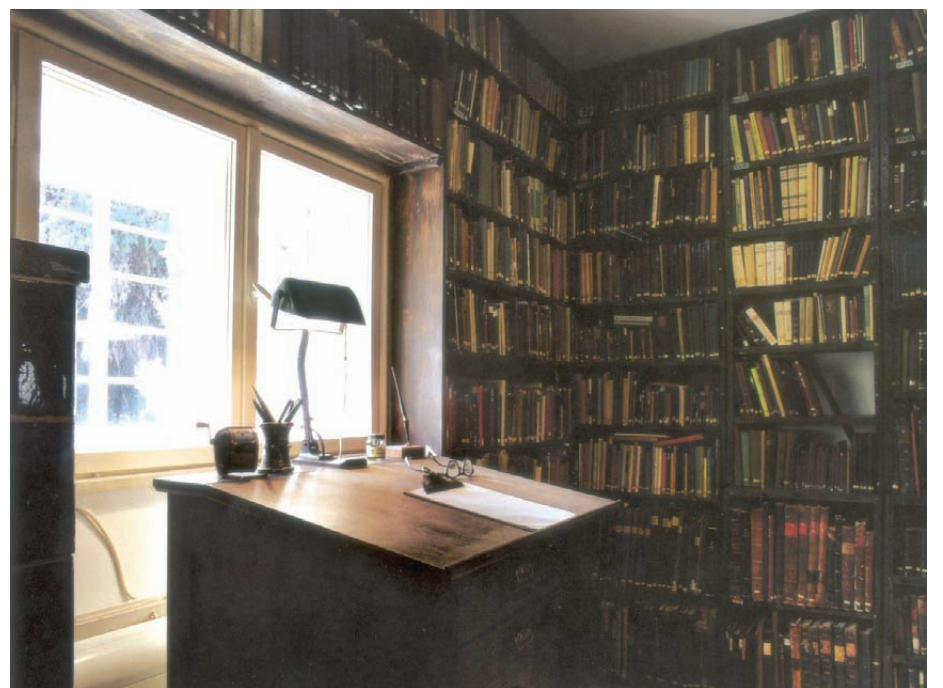
חדר העבודה של הסופר ש"י עגנון

משרדיות, המוני קלסרים ותיקיות מיוגעים, קשי יום, נפוחים מרוב תכולה, שלא היו מביישים שום חדר משרד של פקיד שומה במס הכנסה.