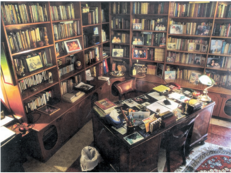
חדר העבודה של המשורר נתן יונתן