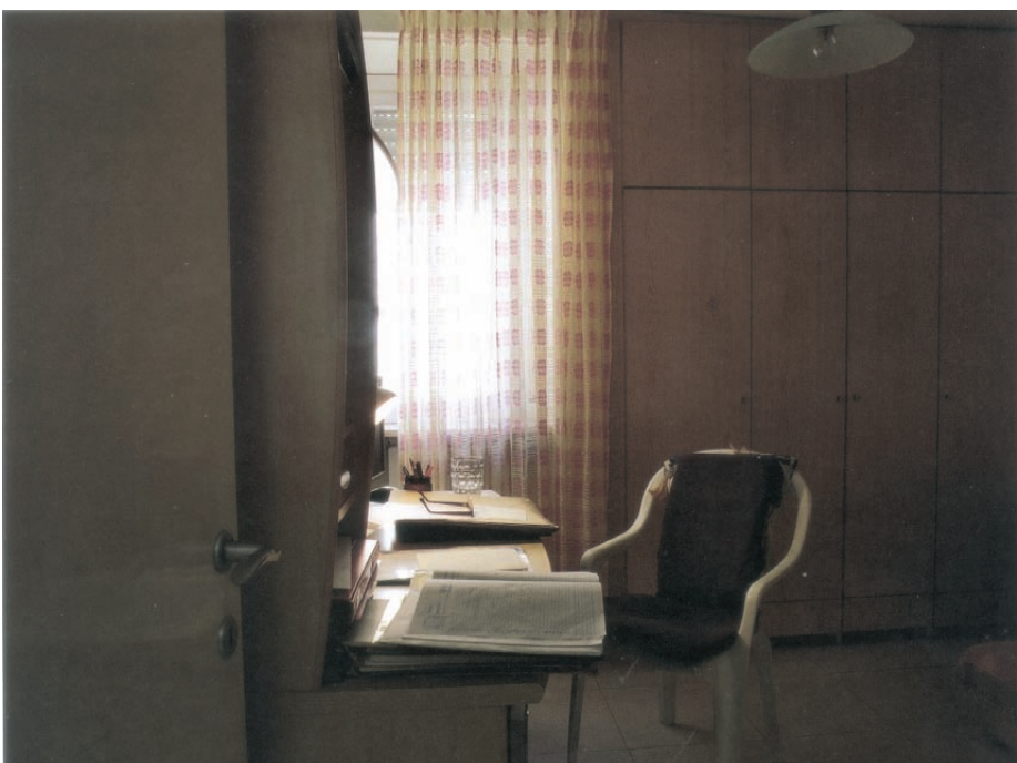
חדר העבודה של הסופר דן בניה סרי