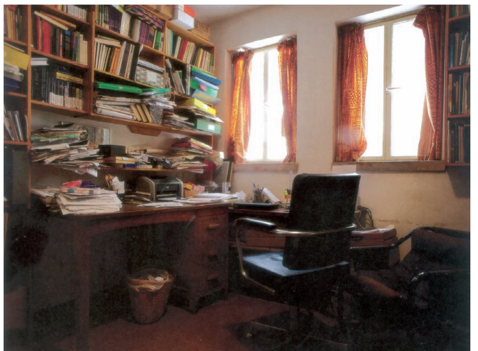
חדר העבודה של המשורר יהודה עמיחי

מוניאונים ואולמות קונצרטים הם חללים ציבוריים שעוצבו בידי ארכיטקטים והאמנים מוזמנים להיכנס אליהם רק לאחר שהם בנויים, את החדרים ב"קירות ורוח" עיצב ותכנן האמן עצמו. כל פותב יצר לעצמו את פינת הכתיבה שלו לפי טעמו ויכולתו, כדי שתשרת אותו ותאפשר לו ליצור את ספריו. "זה אינו חלל תצוגה אלא חלל עבודה", פותבת טלי אמיתי-טביב. "אנו קוראים ספרים אך לרוב איננו פוגשים את הסופרים שכתבו אותם", ממשיכה הצלמת. "ההפרות עמם נעשית, אם בכלל, באמצעות תיווכה של התקשורת - עיתון, רדיו או טלוויזיה. זו הפרות עם דימויים ציבוריים הצומחים סביב דמויות היוצרים. בעבודה זו ניסיתי לצלם דיוקנאות (פורטרטים) של סופרים בלי לצפות בדמותם הפיזית, אלא על ידי צילום המקום הפרטי והקמוס (הסודי), המקום הנסתר מן העין - חדרי העבודה שלהם. אם תרצו - דרך נעלי הבית שלהם".