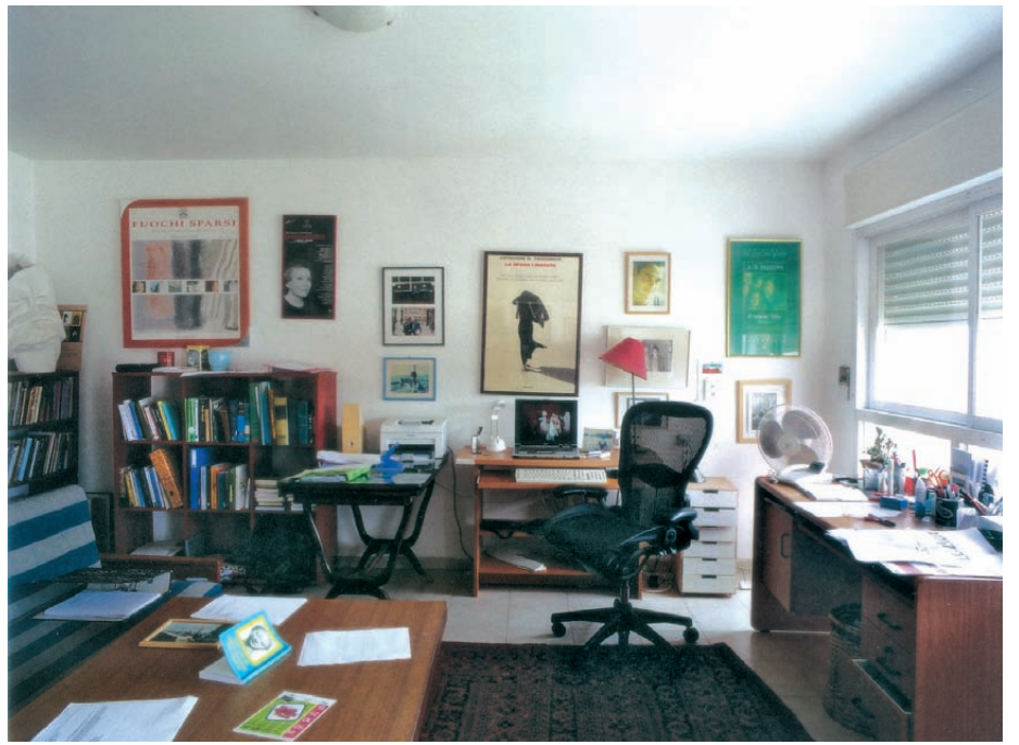
חדר העבודה של הסופר אברהם ב. יהושע