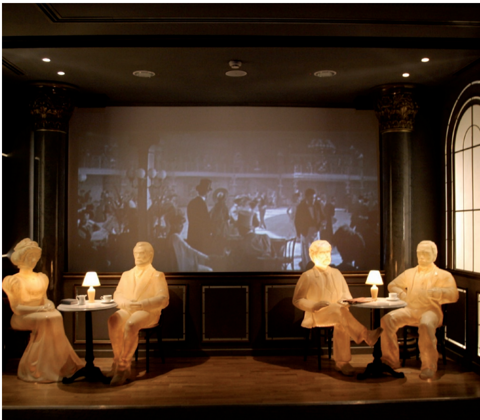
פינה במוזיאון הרצל, שנפתח מחדש בירושלים