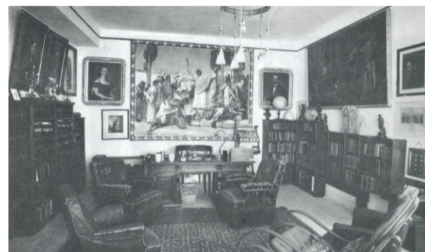
חדר הרצל במוזיאון הרצל

הרצל התחיל להבין, שהשאלה היהודית מחייבת פתרון לאומי ופוליטי. הוא חשב שרק על-ידי הקמת מדינה לעם היהודי, תיפתר מצוקת (הבעיה הקשה של) היהודים ותיעלם האנטישמיות. את קוזונו החדש הוא הציג בחיבור שקרא לו "מדינת היהודים". החיבור התפרסם בפברואר 1896 ועורר ויכוח סוער: האליטה היהודית המשכילה דחתה את תוכניתו של הרצל, הן בגלל סיבות אידיאולוגיות והן בגלל סיבות מעשיות. ההמונים היהודים דווקא התלהבו מהרעיון וראו בהרצל "משה רבנו מודרני".