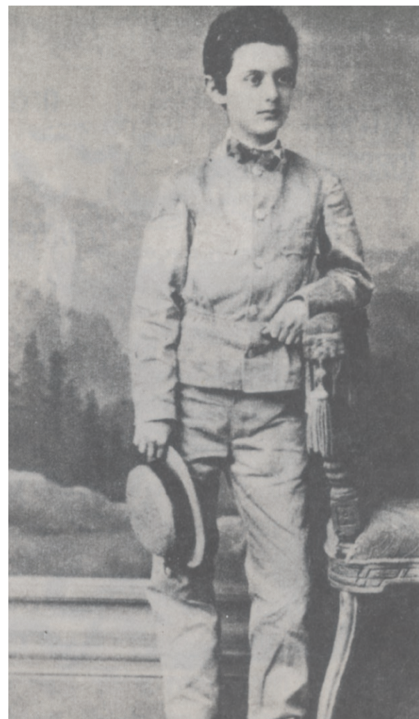
הילד תיאודור הרצל