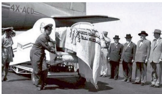
מביאים את ארונו של הרצל לקבורה בירושלים

בשנת 1897 פיסס הרצל את הקונגרס הציוני הראשון בפאזל שבשווייץ, שם הוקמה ההסתדרות הציונית העולמית, והרצל נבחר לנשיא שלה. בשנה זו הוא גם ייסד את עיתונו הציוני "די וולט".