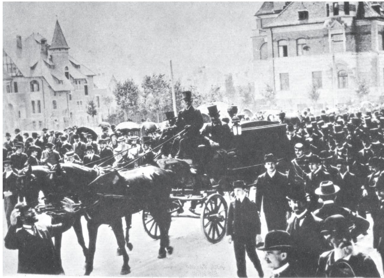
הרצל נפטר ב־3 ביולי 1904 (כ' בתמוז תרס"ד) והובא לקבורה בווינה, בלווייה רבת משתתפים

למען קידום התנועה הציונית ללא לאות (פלי להתעניין, בלי הפסקה). אך מצב בריאותו הלך והורע, וביולי 1904 נפטר הרצל בעיירת מרפא באוסטריה. אבל החלום שלו לא מת אתו, והנרע שררע הרצל הפך למדינה שבה אנו חיים היום.