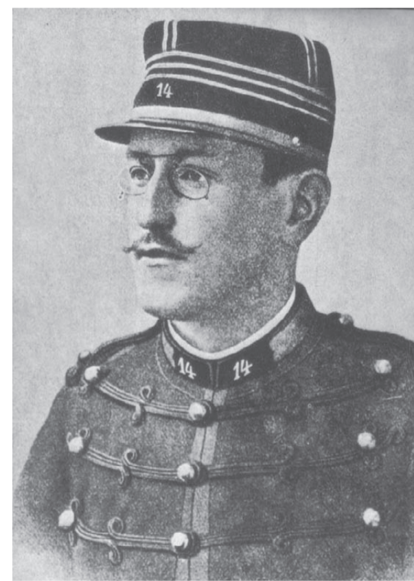
הקצין היהודי אלפרד דרייפוס, שנאשם בבגידה בצרפת

הקדיש כל דקה מחייו לנושא. הוא נפגש עם שר המושבות הבריטי, עם הסולטן התורכי, עם הקייזר הגרמני, עם מלך איטליה ועם האפיפיור. הוא כינס בשנת 1897 את הקונגרס הציוני הראשון בבאזל שבשווייץ, שם הוקמה ההסתדרות הציונית העולמית והרצל נבחר לנשיא שלה. בשנה זו הוא גם ייסד את עיתונו הציוני "די וולט". בקונגרס הציוני השישי ב־1903, בהשפעת הוועד