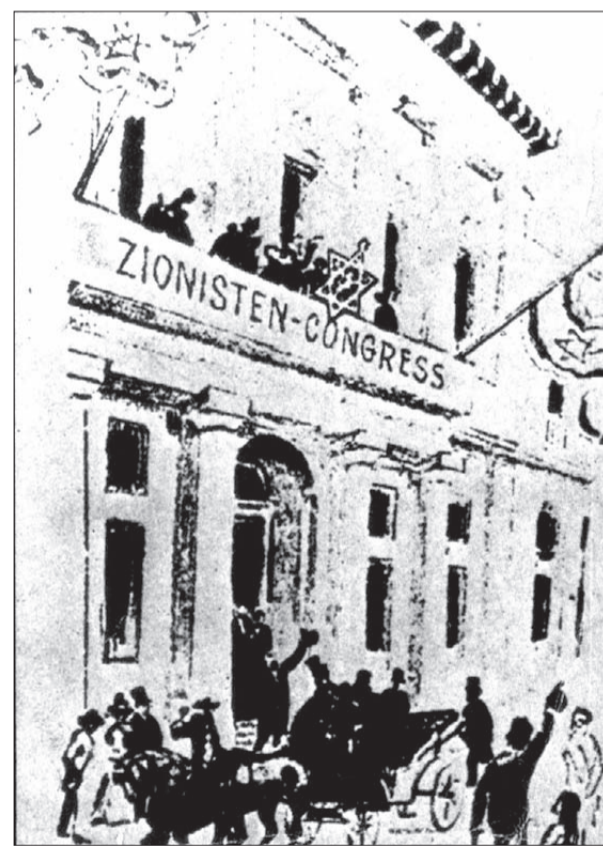
בניין הקיזנו בבאזל, שבו התקיימו הקונגרסים הציוניים הראשונים

השוק הקשה שפקד את העולם היהודי בעקבות פרוצות (פוגרום) קישינב, העלה הרצל את "תוכנית אוגנדה" - הצעה לישיב יהודים באוגנדה. אבל ההתנגדות הקריפה (הקשה, החזקה) לתוכנית גרמה להרצל לוותר עליה. הוא המשיך להיפגש עם מנהיגים בעולם ולפעול