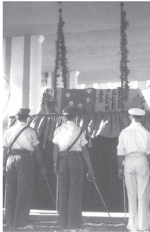
ארונו של הרצל - בישראל, 17 באוגוסט 1949