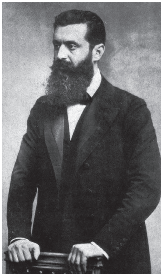
בנמין זאב הרצל (1860-1904)

הרצל האמין לא רק בזכותו של העם היהודי למדינה משלו, אלא גם בכך שהמדינה הזאת צריכה להיות דוגמה ומופת לעולם כולו. עיקרי החזון