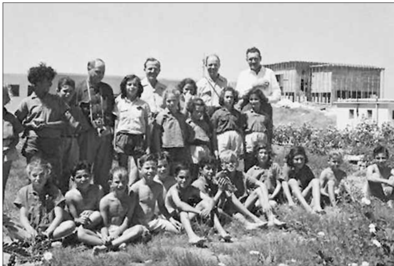
ילדים ומורים בקיבוץ חולדה, בשנות החמישים

כל האמהות אוהבות את הילדים שלהן: כאלה הם חוקי הטבע. אפילו חתולה. או עז. אפילו אמהות של פושעים ורוצחים. אפילו אמהות של מפלצות (יצורים מפחידים). זה שרק אותי אי-אפשר היה לאהוב, זה שאמא שלי ברחה ממני, זה רק מוכיח שאותי פשוט אין בעד מה לאהוב. שלא מגיעה לי אהבה. משהו לא בסדר אתי, משהו נורא מאוד, משהו דוחה ומבעית (מפחיד), משהו מזוויע (רע מאוד) באמת, מאוס (לא אהוב) עוד יותר מאשר מום או פיגור או טירוף (שיגעון). משהו נתעב (רע מאוד) בי ללא תקנה (בלי סיפוי), משהו כל-כך איום עד שאפילו אמי, אשה נפשית ועדינת רגשות, אשה שידעה להרעיף (לתת הרבה) אהבה על ציפור, על קבוצת בסמטה, על גור פלב תועה (לא מוצא את הדרך), אפילו היא לא יכלה כבר להמשיך לסבול אותי והיתה מוכרחה לקום סוף-סוף ולברוח ממני הכי רחוק שרק יכלה לברוח. בערבית יש פתגם כזה, כל קירד בעין אמו - ר'זאל, כל קוף בעיני אמו הוא